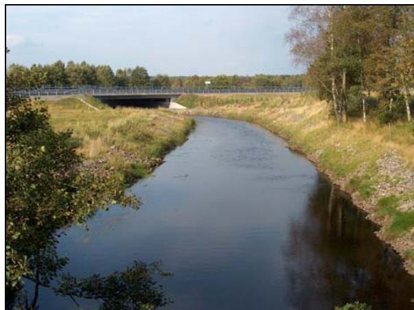
Pinnån, motorvägsbron (omgrävd sträcka nedströms motorvägsbro för väg E4)