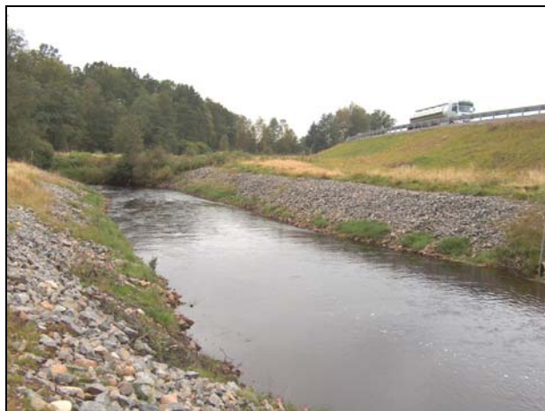
Pinnån, Björkliden (omgrävd sträcka vid väg E4 trafikplats Örskelljunga syd)